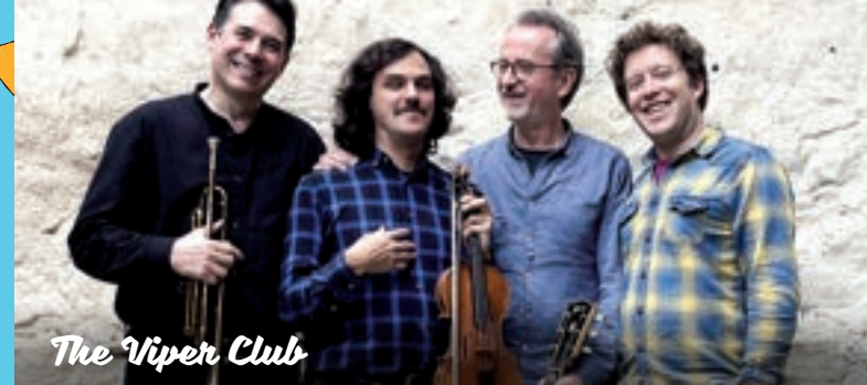
The Viper Club

19H30 - Philly's Hot Loaders : Walkin' - PARADE